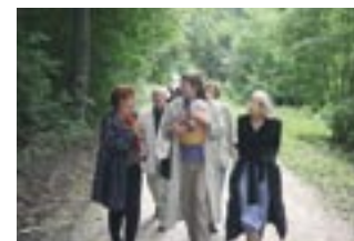
WANDERUNG von Weimar nach Tiefurt zur Freiluftaufführung DIE FISCHERIN im Tiefurter Park am 27. August 2006.