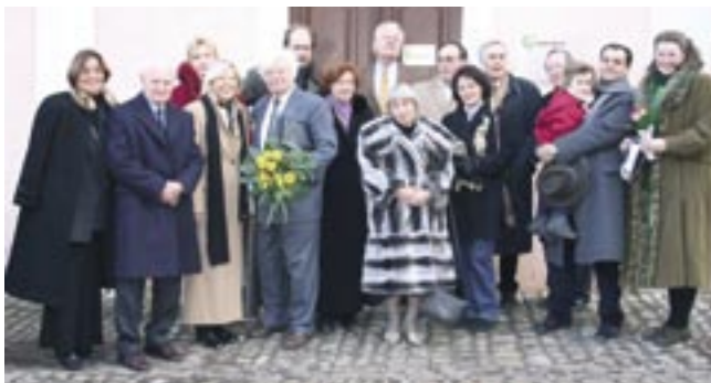
GRÜNDUNGSVERSAMMLUNG am 18. Februar 2006 vor dem Goethe-Institut (Haus der Frau von Stein).