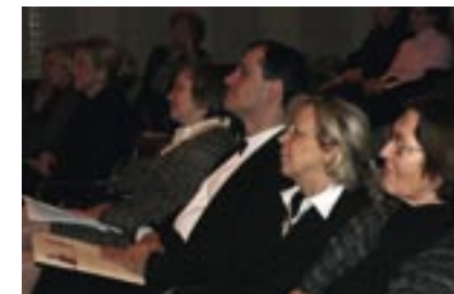
GRÜNDUNGSMATINEE am 19. Februar 2006 in Belvedere mit Schuberts und Anna Amalias Vertonungen von Goethes Liedern.